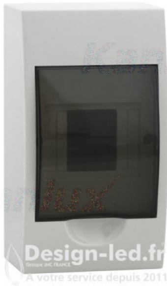
Tableau de distribution 4 modules DB104S 1X4P/SMD, kanlux 3830