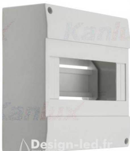
Tableau de distribution 8 modules DB108W 1X8P/SM