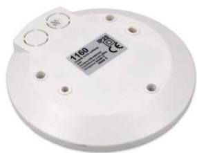
Design-led.fr A votre service depuis 2011