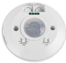
Design-led.fr A votre service depuis 2011