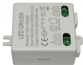
Design-led.fr A votre service depuis 2011