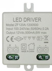
Design-led.fr A votre service depuis 2011