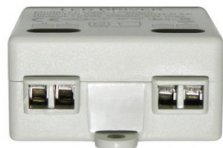
Design-led.fr A votre service depuis 2011